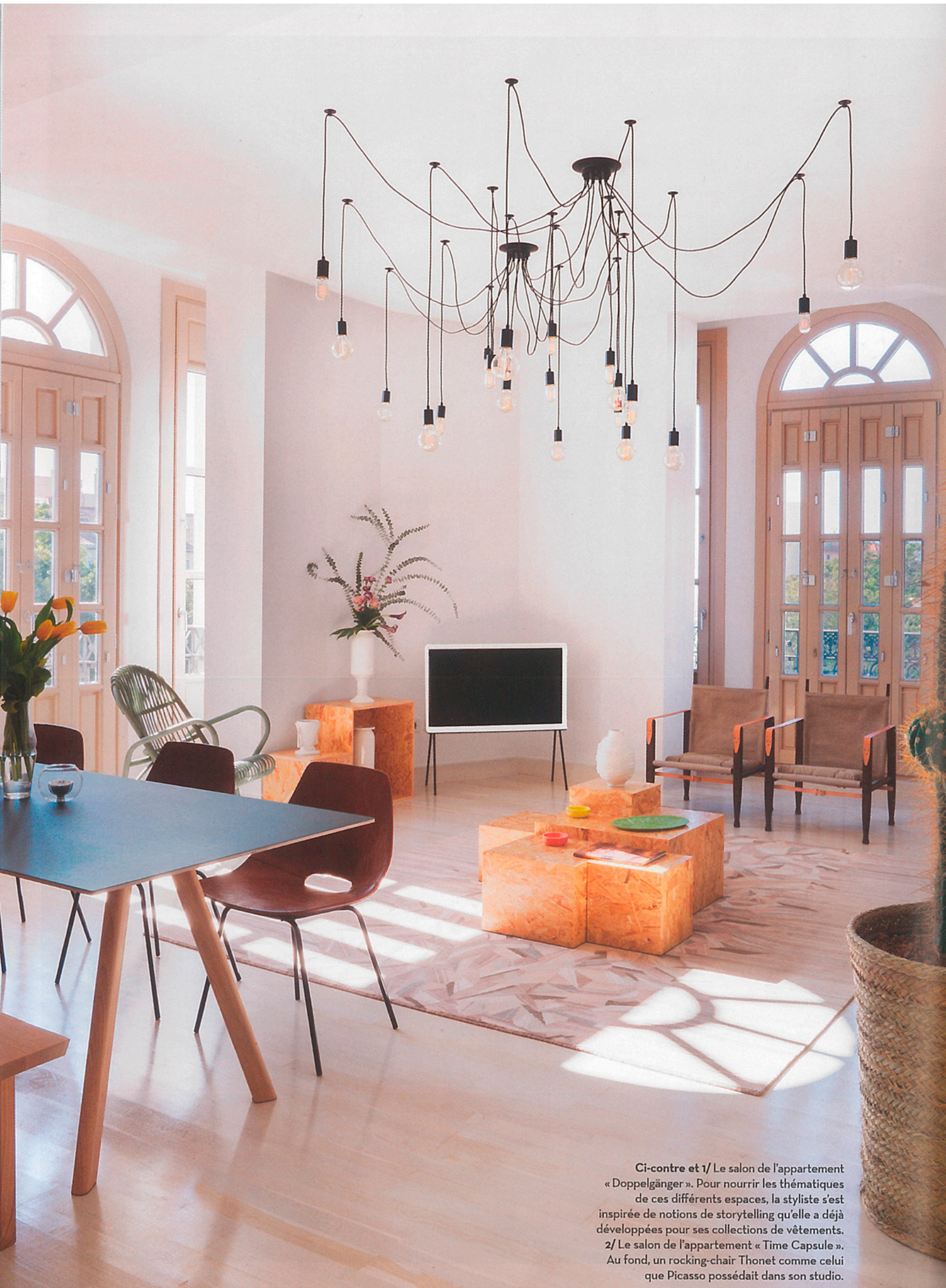
Ci-contre et 1/ Le salon de l'appartement « Doppelgänger ». Pour nourrir les thématiques de ces différents espaces, la styliste s'est inspirée de notions de storytelling qu'elle a déjà développées pour ses collections de vêtements. 2/ Le salon de l'appartement « Time Capsule ». Au fond, un rocking-chair Thonet comme celui que Picasso possédait dans son studio.