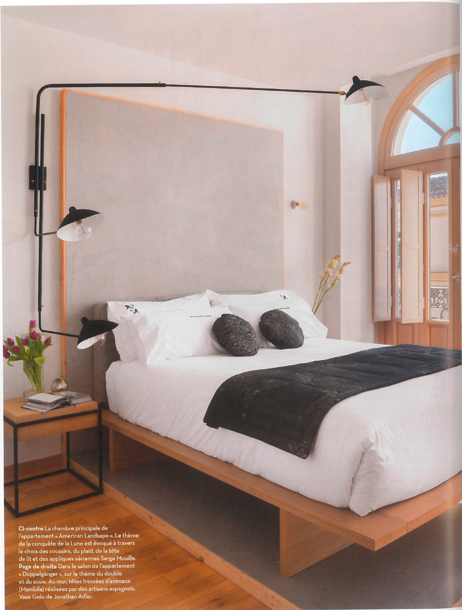
Ci-contre La chambre principale de l'appartement « American Landsape ». Le thème de la conquête de la Lune est évoqué à travers le choix des coussins, du plaid, de la tête de lit et des appliques aériennes Serge Mouille. Page de droite Dans le salon de l'appartement « Doppelgänger », sur le thème du double et du sosie. Au mur, têtes tressées d'animaux (Mambila) réalisées par des artisans espagnols. Vase Gala de Jonathan Adler.