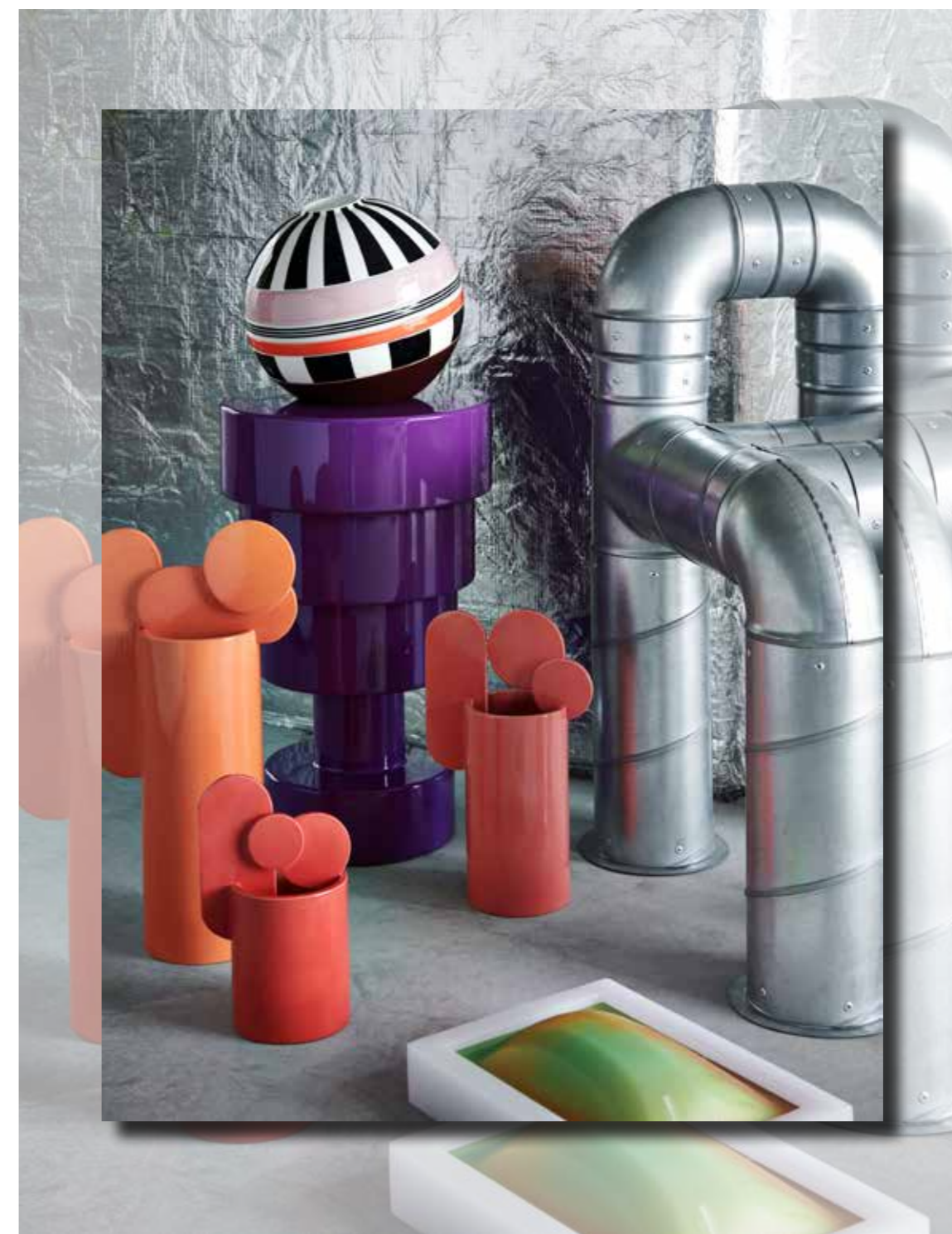
vlnr handgemaakte keramieken vazen Bubble € 820, € 490 en € 660 CuoreCarpenito, kruk Pilastro € 235 Ettore Sottsass voor Kartell, balvormig stapelbaar servies La Boule memphis € 299 Villeroy & Boch, kunstobject P.O.V. Brick van Ward van Gemert poa Nightshop, stoel Tubular poa Lucas Munoz