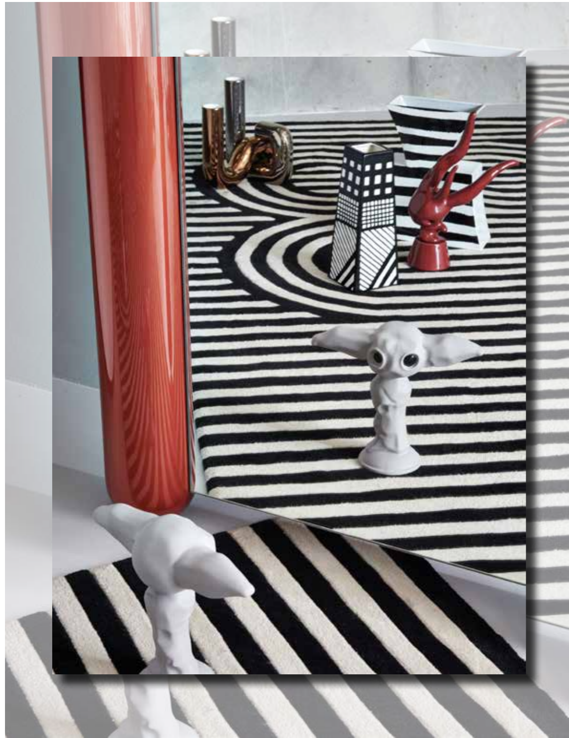
vloerkleed ontworpen voor Museum Boijmans Van Beuningen poa Thonik, spiegel Soufflé poa Luca Nichetto voor La Manufacture, sculpturen Momonsters va € 220 Giovanni Motta voor Bosa Trade, buisvormige vazen Pi-Dou poa Alvino Bagni voor Tacchini, zwart-witte vazen Chicago en Candy beide € 790 van Roger Selden Post Design via Artemest