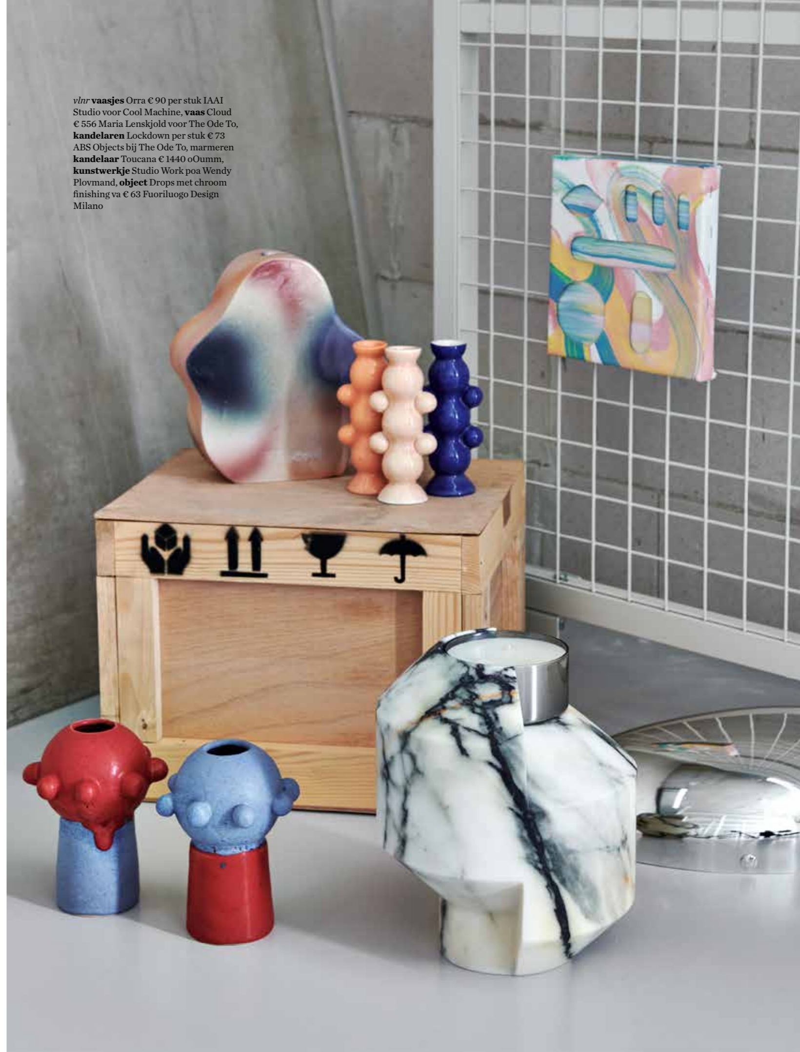
vlnr vaasjes Orra € 90 per stuk IAAI Studio voor Cool Machine, vaas Cloud € 556 Maria Lenskjold voor The Ode To, kandelaren Lockdown per stuk € 73 ABS Objects bij The Ode To, marmeren kandelaar Toucana € 1440 oOumm, kunstwerkje Studio Work poa Wendy Plovmand, object Drops met chroom finishing va € 63 Fuoriluogo Design Milano