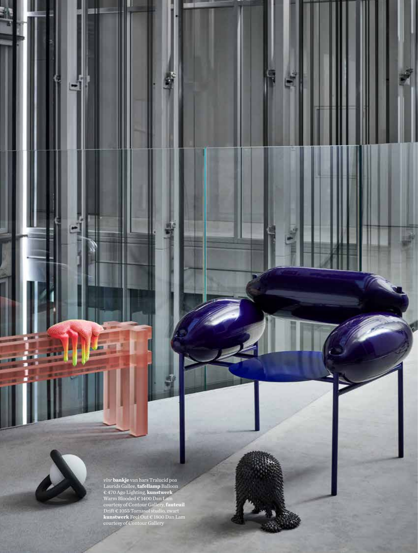
vlnr bankje van hars Tralucid poa Laurids Gallee, tafellamp Balloon € 470 Ago Lighting, kunstwerk Warm Blooded € 1400 Dan Lam courtesy of Contour Gallery, fauteuil Drift € 1055 Tornasol studio, zwart kunstwerk Peel Out € 1800 Dan Lam courtesy of Contour Gallery

vlnr modulaire bank Pantanova van Verner Panton va € 1199 per module Montana, staande lamp uit de Inert Domestic System Series poa Célestine Peuchot, rood object uit de Purple Objects 2020-collectie € 120 Britte Koolen, gele bal A Story of Control poa Matilde Patuelli, kleding Snooker € 890 en poef Shit € 390 Seletti Wears Toiletpaper, paars blok met rode cirkel en zwart blok met paarse driehoek uit de Purple Objects 2020-collectie € 450 en € 500 Britte Koolen, roze en pastelgele kandelaar Funnel à € 149 Rotganzen