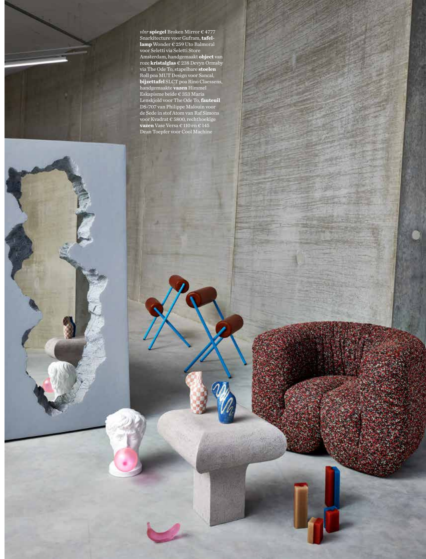
vlnr spiegel Broken Mirror € 4777 Snarkitecture voor Gufram, tafel-lamp Wonder € 259 Uto Balmoral voor Seletti via Seletti Store Amsterdam, handgemaakt object van roze kristalglas € 238 Devyn Ormsby via The Ode To, stapelbare stoelen Roll poa MUT Design voor Sancal, bijzettafel SLCT poa Rino Claessens, handgemaakte vazen Himmel Eskapisme beide € 353 Maria Lenskjold voor The Ode To, fauteuil DS-707 van Philippe Malouin voor de Sede in stof Atom van Raf Simons voor Kvadrat € 5800, rechthoekige vazen Vase Versa € 110 en € 145 Dean Toepfer voor Cool Machine