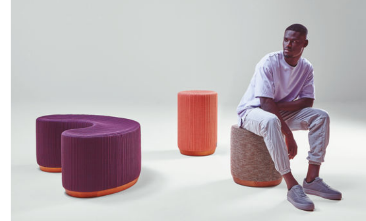
系列中最為靈活的成員：Dividuals，提供兩件風格當代、線條有機的座墊，可獨立或組合成整體使用。