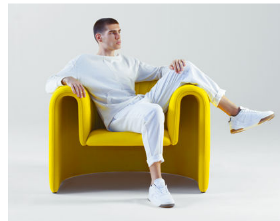
從古典家具造型擷取靈感的Core和Remnant，前者形態飽滿，後者像是「雕塑家製作Core後摒棄的剩餘物料」，各自獨立又發揮互補作用。

“What defines an object? The matter itself, or the void that surrounds it?”