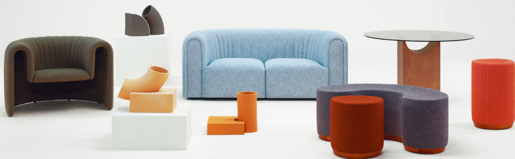
Note Design Studio與西班牙Sancal攜手研發的Void Matters系列。

撰文 · Kim Hau